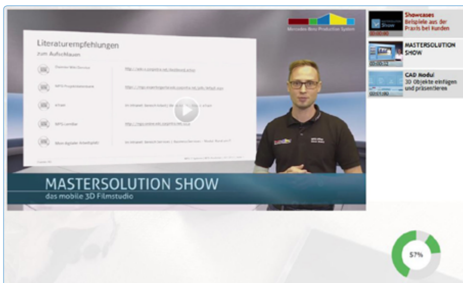
Videoeinbindung als Lernaktivität in MASTERSOLUTION LMS

Zusätzlich gibt es die Möglichkeit, die Trainingsvideos via PlugIn in MASTERSOLUTION LMS zu integrieren. Das folgende Beispiel zeigt die Integration in ein moodle-basiertes Lern Management System. Neben der Einbindung des Videos ist hier zusätzlich die komplette Lernfortschritts-Kontrolle (z.B. wie viel Prozent des Videos muss ein Teilnehmer angeschaut haben) realisiert.